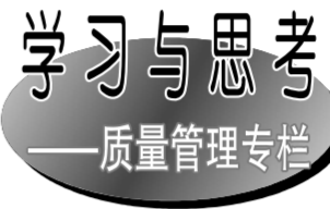
学习与思考——质量管理专栏

作为一名财务人员,其工作职能是核算和监督,尤其是核算职能,在核算上这个岗位有更具体化的体现。从表面上看,核算员的工作就是做一些材料调拨、数据录入、统计和报表,实则这些基础性的数据核算工作能够全方位地反映企业的经营状况和具体问题,为企业管理者制定决策提供科学依据,还能够依靠相关数据的整理和分析,有效地控制企业发展中存在的问题和隐患,采取必要的策略,实现良好的风险控制。如何做好核算员工作,结合平时的实际情况,我总结了以下几点: 一、日常数据管理要认真,还需较真。首先,想要做好数据的准确和有效性,生产车间的核算员必须熟悉各产品生产工艺流程和各产品所需原料及把握各产品消耗定额等。如此才能对实际发生的生产数据等进行日常录入和各类报表填制,这些日积月累的生产数据将成为分析依据,核算员不仅要认真、准时、准确地录入数据,更要对标准值进行分析以及对数据来源的真实性负责;其次,严谨的工作态度决定了工作质量,偶尔有人在填制报表的最后发现数据有小到两位小数点后的错误,或许会认为这0.01对一个千万元的数额来说影响不大,四舍五入之后甚至可以忽略,其实不然,今天你放过了0.01元的差额,明天你可能会放过0.10元的差额,而慢慢地后面的单位甚至会变成“万元”,所以,对数据不仅要认真对待,还要有较真的精神,不放过任何大小的误差。 二、业务沟通要团结协作、互帮互助。核算员的工作不仅是面对生产记录本上那些数据,更多时候会面对各部门的业务往来。在工作中,我们每个员工并不是独立的个体,部门与部门之间