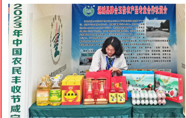
图片新闻(二) 9月23日,“丰收·促和美”2023年中国农民丰收节咸宁主会场活动在通城县举行,玉立集团旗下的玉怡农产品专业合作社积极参加此次活动。图为玉怡农产品专业合作社展位。