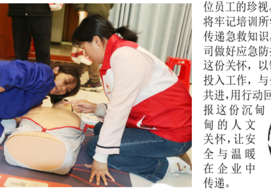
职业人群应急培训现场

此次培训绝非形式化宣讲，而是干货十足的实操课堂。通城县红十字会救护师专业细致，从心肺复苏的按压频率、深度，到出血、骨折等外伤处置，每一个细节都讲解透彻。理论学习中，我们系统掌握职业健康知识，深刻认识