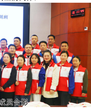
公司与通城县红十字会成员合影

活动现场氛围热烈，参与人员纷纷表示，此次培训内容实用性强，不仅增强了自身职业病防护意识和心理健康观念，更学会了可直接应用于工作生活的应急急救技能，切实为自身安全增添了保障，也感受到了政府和公司对一线员工的关怀。