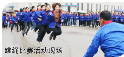
跳绳比赛活动现场