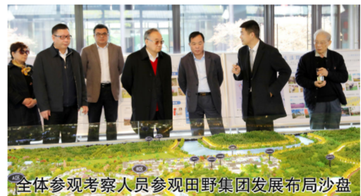
全体参观考察人员参观田野集团发展布局沙盘

团的发展历程、发展模式可谓异曲同工。 参观过程中,我们看到了现代化的高科技工业园,整齐的农民别墅和员工公寓,功能齐全的文化中心、培训中心,依山而建的田野山庄、专家公寓,四季长青的森林公园等,自然环境幽雅,民风淳朴和谐,生活文明富裕,物质文明、政治文明与精神文明协调发展。充分体现了党中央提出的“生产发展、生活宽裕、乡风文明、村容整洁、管理民