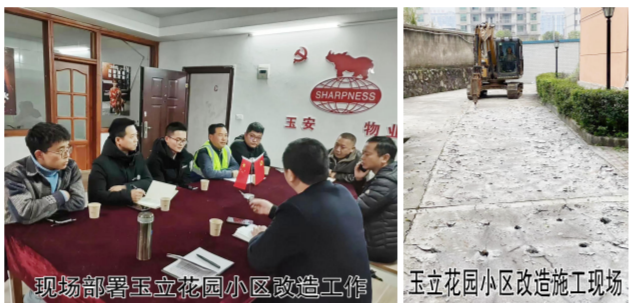
现场部署玉立花园小区改造工作

【本报通讯员 黎时才、付志刚报道】老旧小区改造一直是老百姓关注的民生大事,3月28日上午,在住建局和小区业主的共同努力下,玉立花园小区正式启动老旧小区改造工程。 据了解,玉立花园小区是通城县早期最先的小区,曾获咸宁“美好家园”示范小区称号,共有17幢高层建筑,862户居民。随着时代的发展,私家车的普及,道路窄、停车难成了小区难以解决的困扰,特别是污水管网存在重大安全隐患。本次改造包括道路、给水、排水、绿化、弱电入地、安保、消防等设施的升级改造及景观的升级。玉安物业公司负责人提请玉立花园小区广大业主能够支持老旧小区改造工作,大家在一块同心协力,把咱们的花园小区建设成一个整洁、文明、和谐的小区。县住建局也表示将继续深入沟通,动员更多群众力量参与,推进小区环境进一步改造提升。 为确保拆除工作安全有序,县住建局联合花园小区物业部门在安全距离外拉好警戒线,由专人负责现场安全引导,确保施工顺利有序。眼看玉立花园小区将焕然一新,不少围观居民都拍手叫好!