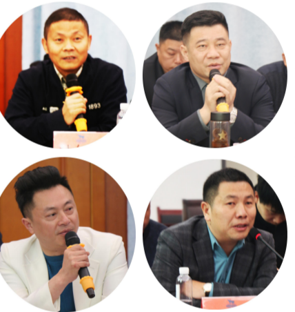
与会的驻外销售代表纷纷发言

据悉，绿盾全国企业征信系统创建于2002年，是国内第一家第三方大数据征信平台，也是目前国内最全面、最科学、最具权威性的企业征信系统之一。根据来自绿盾方面的信息，该征信系统主要依据《征信业管理条例》第21条，通过采集各政府职能部门对企业的监管信息、行业评价信息、媒体评价信息、金融信贷信息、企业运营信息及市场反馈信息等六大方面信息，并综合分析，形成企业的信用档案，由