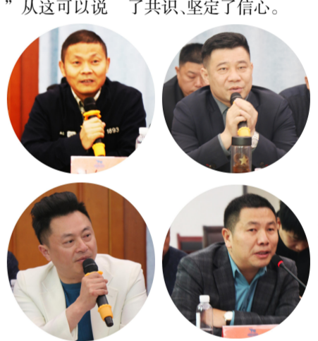
与会的驻外销售代表纷纷发言

本次座谈会的召开，明确了下一步公司市场营销工作思路，为公司找准市场定位，加强协调沟通，确保市场营销各项工作落到实处落细，在新征程上再出发凝聚了共识、坚定了信心。